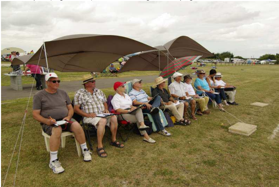
Les juges sur l'axe d'évolution le long de la piste