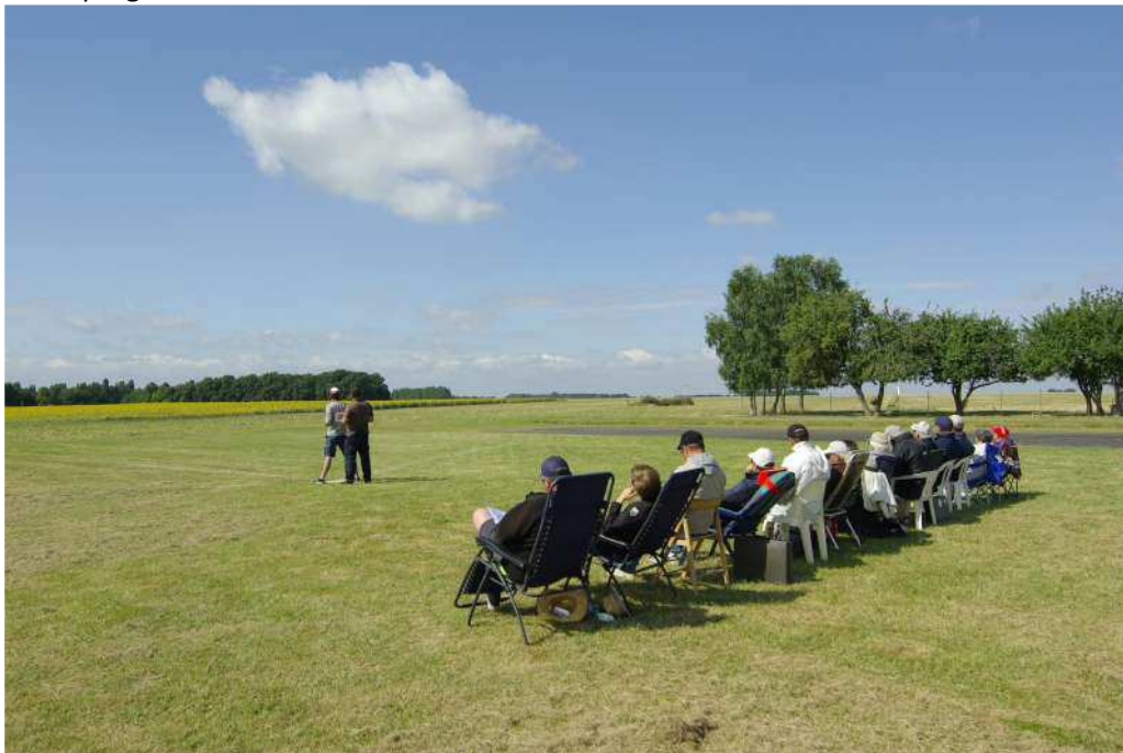
Axe d'évolution transversale (aucun risque de sécurité)