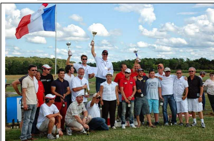
Podium catégorie internationale