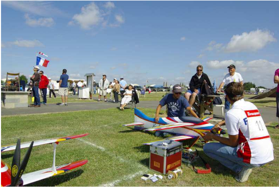
Aire de démarrage des modèles