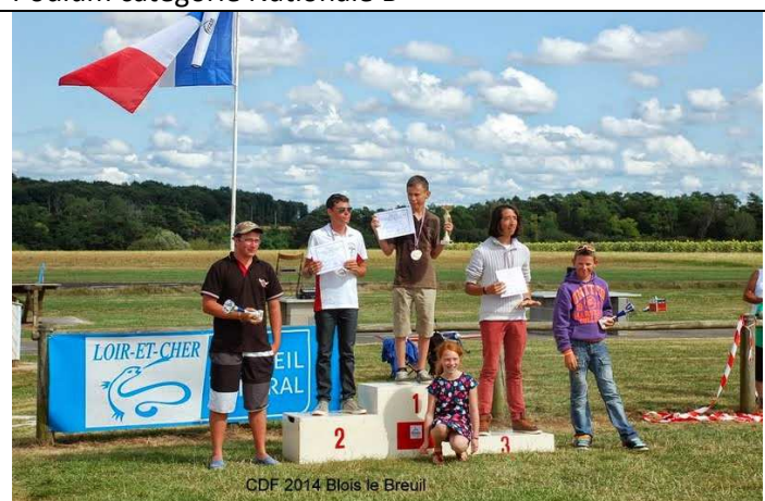
Podium catégorie Nationale A Junior