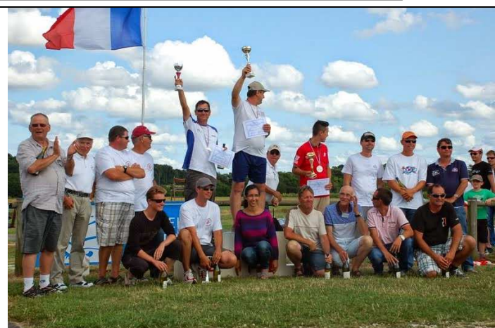
Podium catégorie Nationale B