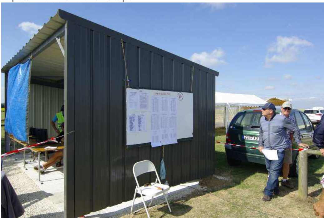
Hangar de comptage des points et tableau d'affichage