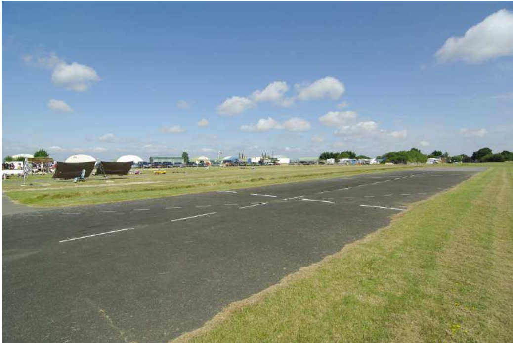
La piste – Aérodrome en arrière plan

Hangar pour le comptage des points au bord du parking avion Sonorisation avec micro en piste Chapiteau pour la restauration et l'abri des modèles Parasols pour les juges en piste lorsque nécessaire