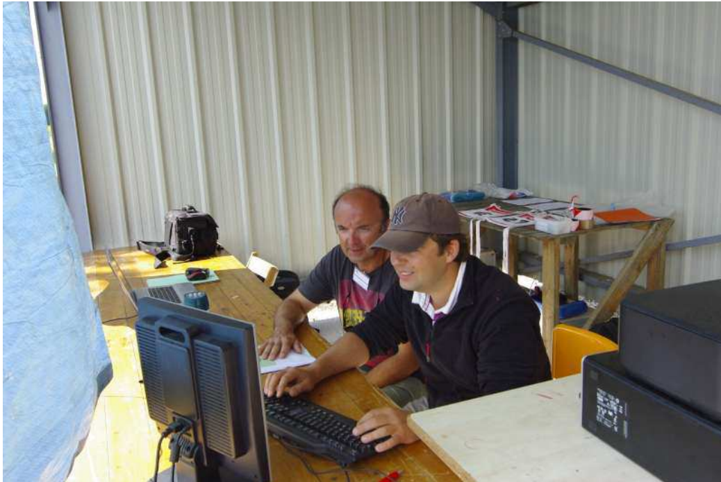
Le comptage en cours