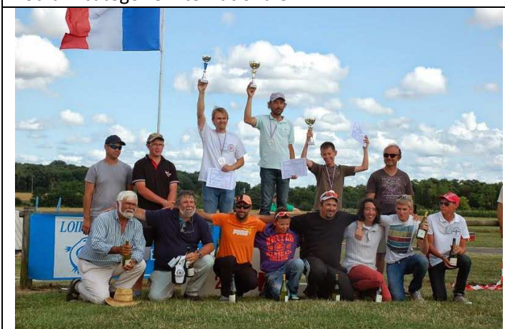
Podium catégorie Nationale A